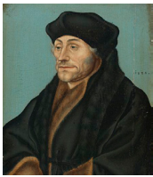
Erasmus von Rotterdam niederländischer Universalgelehrter (1466 bis 1536)

„Die höchste Form des Glücks ist ein Leben mit einem gewissen Grad an Verrücktheit.“