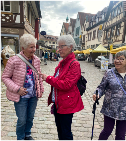
Einmal durch die Fußgängerzone, den Stadtgarten und zum Kloster führte die Bummelstrecke durch Haslach. Zum Kaffee ging's dann ins Rathauscafé.

Die Freitagsgruppe „Fit im Alter“ wird durch die KLAUS-GROHE-Stiftung unterstützt und vom Betreuungsteam der Sozialgemeinschaft organisiert.