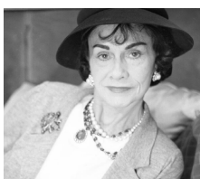
Coco Chanel (1883-1971)

Mit dieser Tat sollte der Reformation in Frankreich auf Befehl der Katharina von Medici endgültig Einhalt geboten werden.