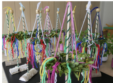
Maibaumtischdeko für dem Maihock im Schlossbergsaal

4. Wie ist die politische Bezeichnung des Maifeiertages heute?